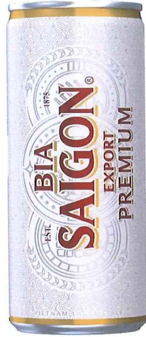
MẶT SAU/ BACK