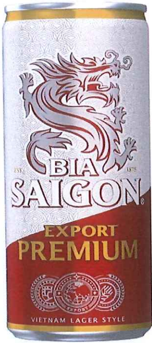
MẶT TRƯỚC/ FRONT